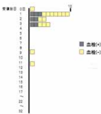
図1. 加療前の血栓発生状況

手術もしくは保存的治療前にエコー検査を行った22例中7例(31.8%)に下腿静脈の血栓を認めた。受傷当日にエコー検査を実施した症例は1例で血栓はなく、受傷翌日は10例のうち3例に血栓がみられ、受傷2日は4例中2例、3日は5例中2例に血栓を認めた(図1)。加療前エコー検査で血栓がなかった症例のうち6例は、後日のエコー検査で血栓が確認された。経過観察時における血