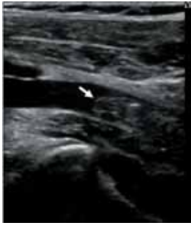
図4. 症例1 33歳 男 受傷から28日後の静脈エコー。 矢印は膝窩静脈内血栓を示す。